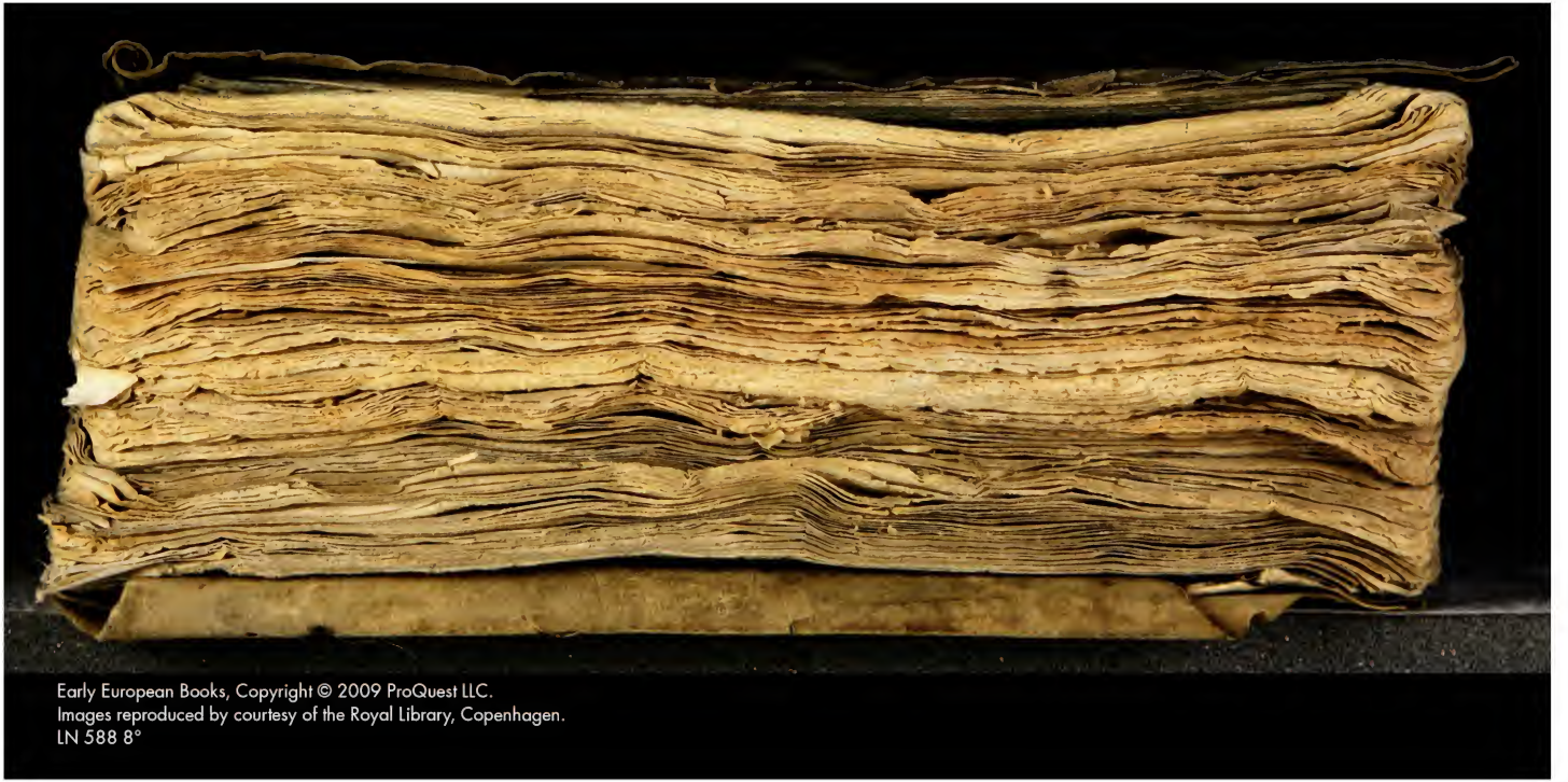
Early European Books, Copyright © 2009 ProQuest LLC. Images reproduced by courtesy of the Royal Library, Copenhagen. LN 588 8°